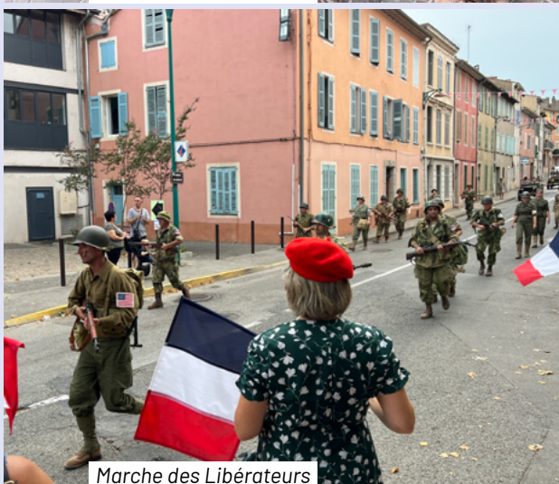
Marche des Libérateurs